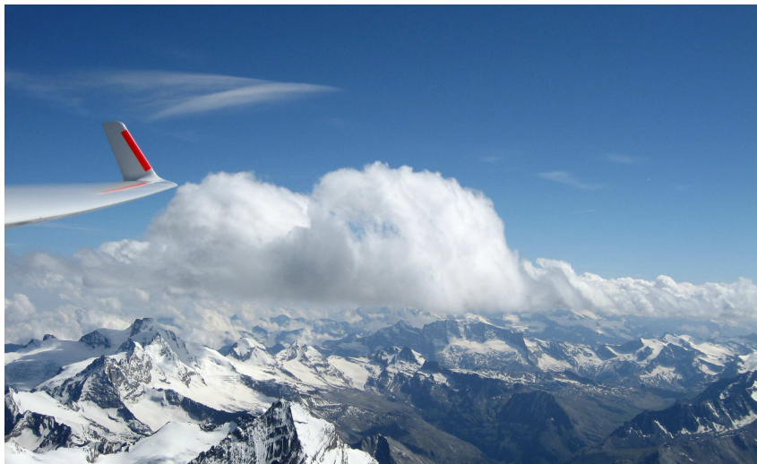
AG FFVV – 2009